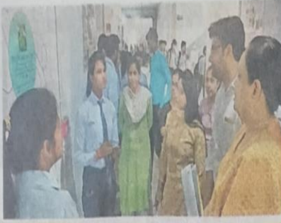
आइएफटीएम विश्वविद्यालय स्टूडेंट डेवलपमेंट सेल की ओर से कराई गई पोस्टर प्रतियोगिता में निर्णायक मंडल को जानकारी देते हुए छात्रा • सी. विश्वविद्यालय