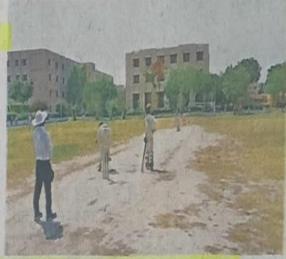
आइएफटीएम में आयोजित क्रिकेट लीग में खेलते खिलाड़ी